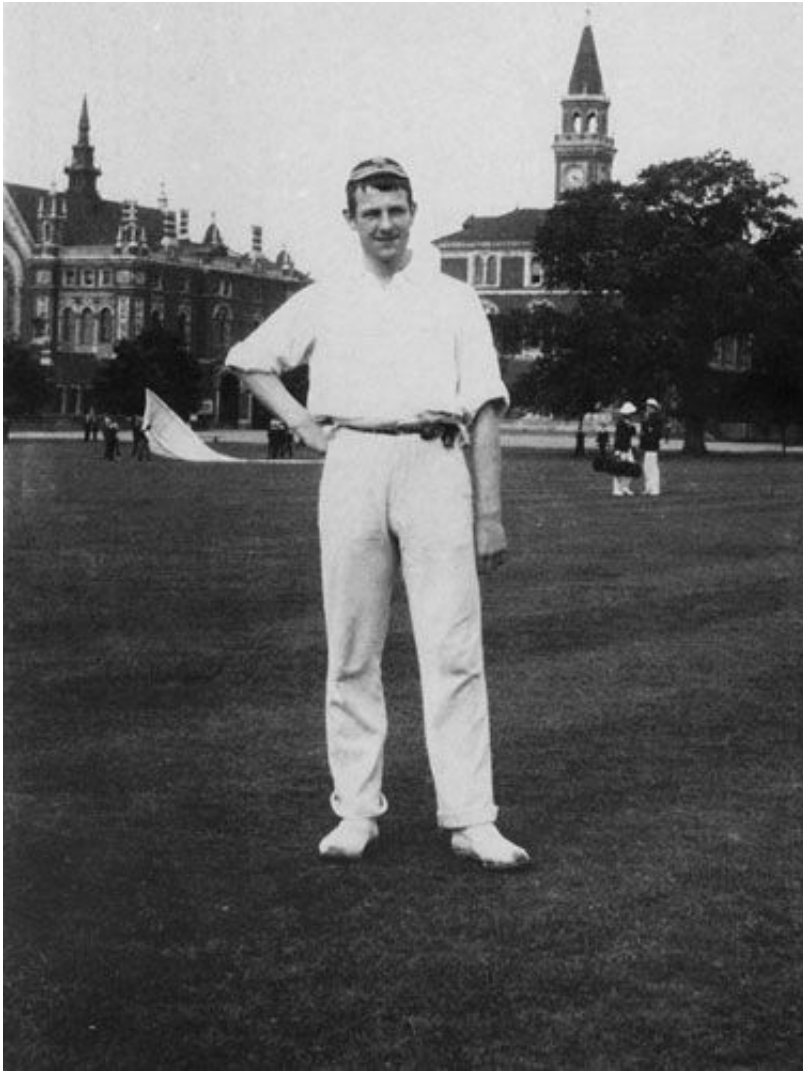
Пэлем Грэнвил Вудхауз в колледже Далвич

«Половина людей понятия не имеет, как живут остальные три четверти»